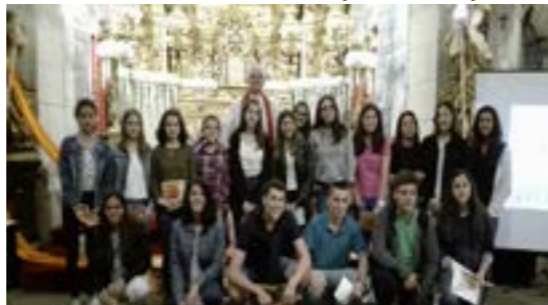
Foram celebradas na Vigília de Pentecostes, no dia 3 de Junho, no Senhor da Cruz.